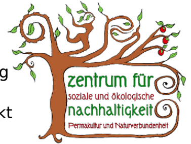
Logo Zentrum für Nachhaltigkeit

Wir haben Gelegenheit, 16 Hektar schönen Wald in Nord-Brandenburg zu kaufen und zu schützen. Stattdessen wollen wir ihn als Klimawald erhalten und ein sozial-ökologisches Wildnis- & Nachhaltigkeits-Projekt aufbauen. Ihr könnt euch jetzt beteiligen, indem ihr Anteile kauft! allmendeland.de -> Downloads -> Kuhlühle Absichtserklärung herunterladen! zentrumfuernachhaltigkeit.de/gelaendekaufen/ wise-wild-sein.de